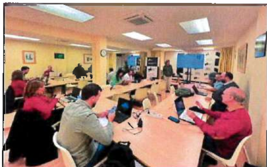
Talleres en la sede la Fundación